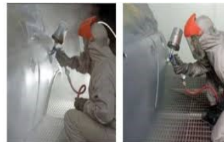
Figure 1 Now you see it